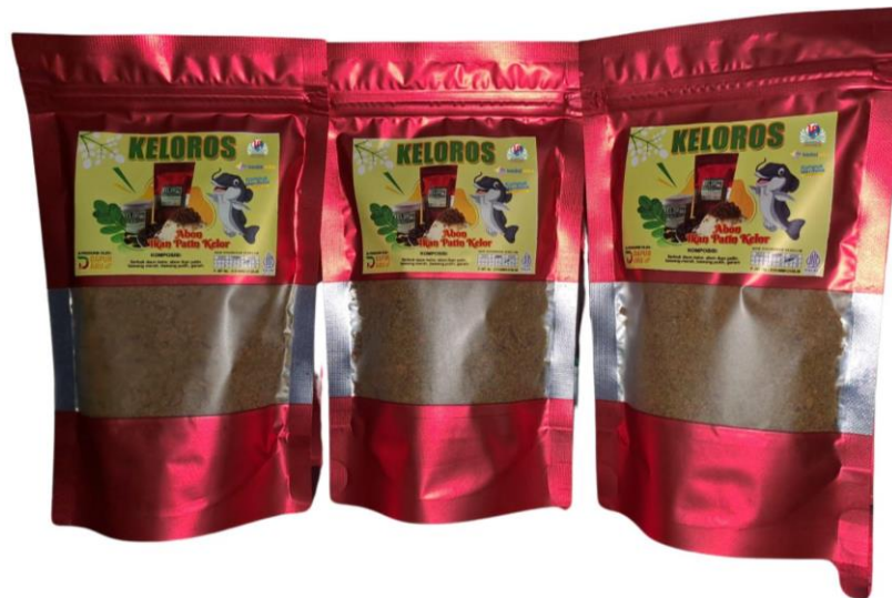
Gambar 1. Contoh design produk

tambahan mengenai produk dan manfaatnya. Ini memberikan nilai tambah bagi konsumen dan membantu membedakan produk PT Mond Nature Lestari dari kompetitor. Evaluasi menunjukkan bahwa peserta pelatihan merasa lebih percaya diri dalam menggunakan perangkat lunak desain grafis dan bahan kemasan ramah lingkungan, yang berkontribusi pada penciptaan kemasan yang lebih inovatif dan berkelanjutan. Namun, pelatihan juga mengidentifikasi beberapa area untuk perbaikan. Misalnya, beberapa peserta masih menghadapi tantangan dalam menerapkan prinsip desain keberlanjutan secara penuh dalam kemasan mereka, terutama terkait dengan pemilihan bahan. Oleh karena itu, penting untuk melanjutkan dukungan dan bimbingan setelah pelatihan untuk memastikan bahwa desain kemasan terus diperbarui dan disesuaikan dengan perkembangan tren pasar dan teknologi. Selain perbaikan visual dan fungsional, pelatihan desain kemasan juga berdampak positif terhadap efisiensi produksi dan distribusi. Desain kemasan baru yang diperkenalkan memperhatikan aspek-aspek praktis seperti ukuran dan bentuk kemasan yang optimal, yang memudahkan proses penyimpanan dan pengiriman. Misalnya, kemasan untuk teh kelor telah diubah menjadi format yang lebih kompak dan mudah ditumpuk, mengurangi ruang yang dibutuhkan dalam gudang dan mengoptimalkan biaya distribusi. Ini tidak hanya mengurangi biaya operasional tetapi juga meningkatkan keseluruhan efisiensi rantai pasokan perusahaan.