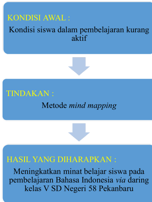
Gambar 2.2 Kerangka Pemikiran

dalam kelas. Kerangka pemikiran dari penelitian ini dapat dilihat pada Gambar 2.2 di bawah ini: