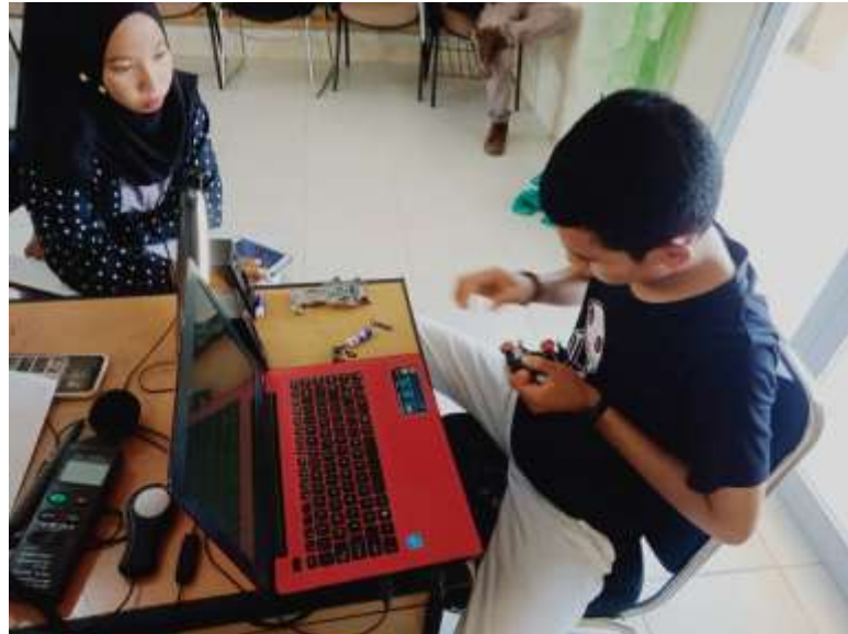
Gambar 8 Contoh Kondisi 4