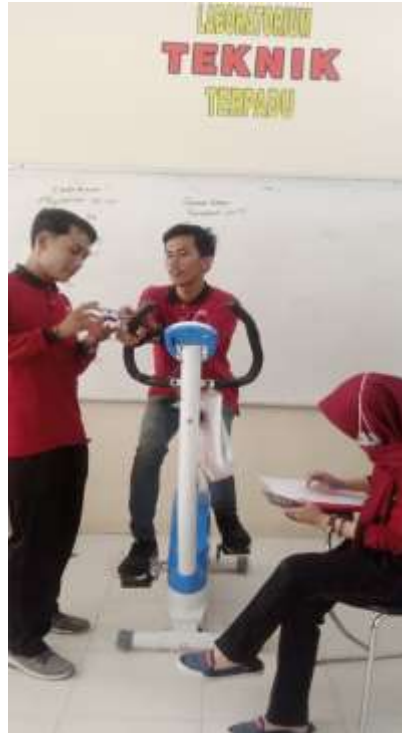
Gambar 4 Pengukuran Denyut Jantung setelah Menggunakan Sepeda Statis