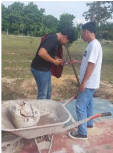
Gambar 3 Pengukuran Denyut Jantung setelah Pengangkatan Beban Menggunakan Lori