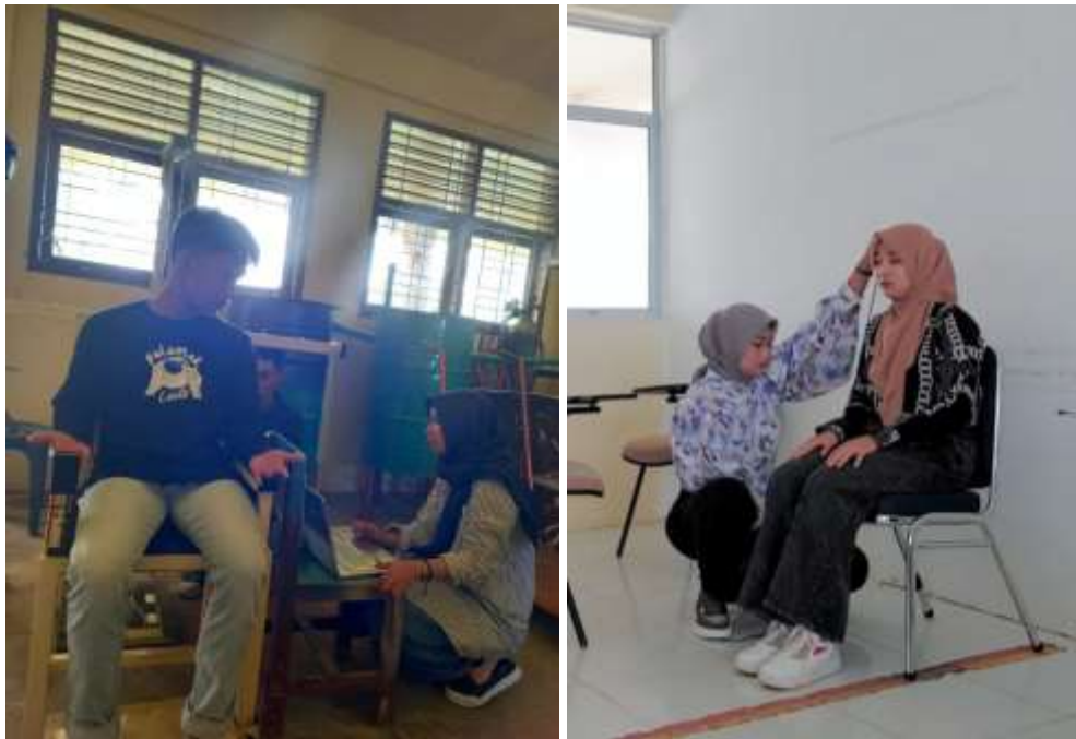
Gambar 2 Pengukuran Tubuh Manusia Menggunakan Kursi Sensor dan Meteran