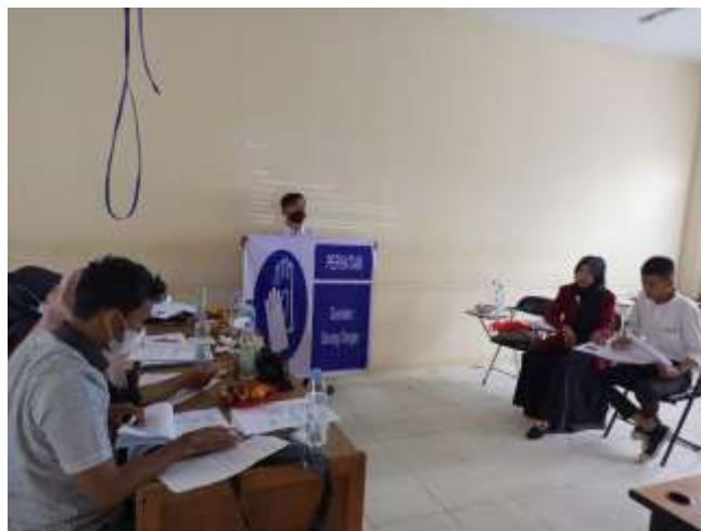
Gambar 9 Contoh Poster Keselamatan dan Kesehatan Kerja (K3)