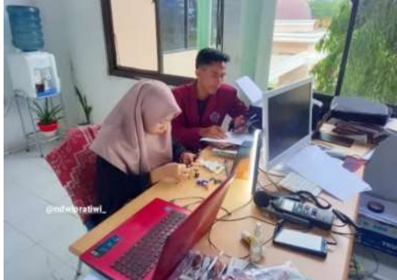
Gambar Contoh Kondisi 2