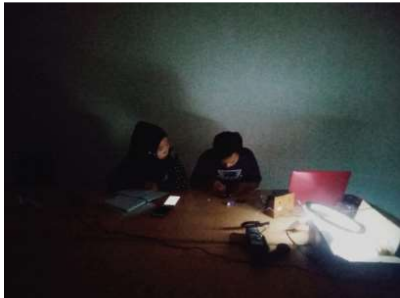
Gambar 7 Kondisi 3