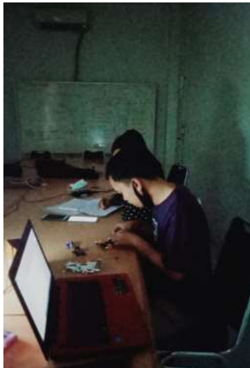
Gambar 6 Contoh Kondisi 1