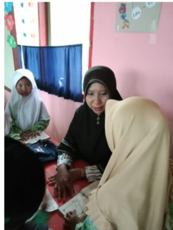
Gambar 3. Kemampuan Komunikasi Guru PAUD

Kemampuan lainnya adalah kemampuan bekerjasama. Seluruh guru bisa menunjukkan kemampuan bekerjasama yang solid dan kompak. Hal ini sangat nampak pada setiap kegiatan yang dilakukan pada pembelajaran yang membutuhkan tim teaching . Hal ini sejalan dengan hasil penelitian Maman et al. (2021) saat pandemi terjadi. Kerjasama ini semakin erat antar guru dikarenakan perubahan pembelajaran yang semula offline menjadi online . Guru-guru yang kurang terampil dalam pembelajaran online belajar kepada guru-guru yang sedikit lebih terampil, sehingga semua guru bekerjasama dengan satu tujuan yang sama, yaitu pembelajaran berkualitas untuk anak-anak usia dini yang diajarnya.