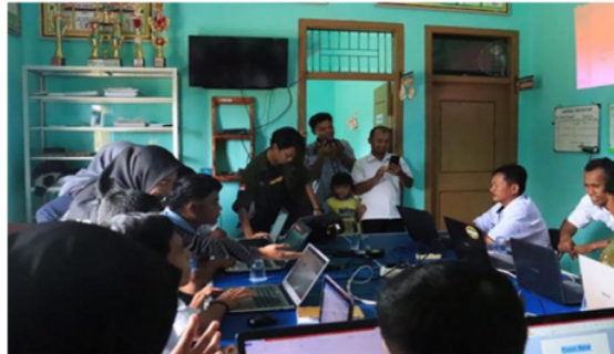
Gambar 2. Proses pelatihan Komputer yang dilakukan oleh tim pengabdian

Selanjutnya, untuk materi pemanfaatan internet positif, tidak dilakukan ujian secara khusus, hanya saja tim kami melakukan penyuluhan kepada para peserta agar dalam menggunakan internet harus pada ranah yang positif. Sebab, banyak konten yang terdapat dalam situas internet yang penggunaannya bukan diperuntukkan untuk usia remaja. konten-konten tersebut bukanlah pada hakikatnya bukan berbahaya, namun diperuntukkan harus disesuaikan dengan usia seseorang. Hanya saja, kita tidak bisa memberikan filterisasi sepenuhnya terhadap konten-konten yang dapat membahayakan moral generasi muda, seperti konten seks, kekerasan, radikalisme, pemberitaan hoax dan intoleran, akibat dari begitu mudahnya kita mengakses internet , seperti terlihat pada Gambar 2.